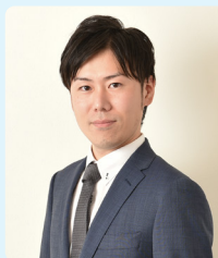
行政書士法人アクティス (福岡県行政書士会)