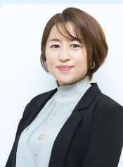
税理士法人アップパートナーズ 相続・事業承継部 (九州北部税理士会)