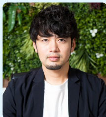
司法書士法人アクティス (福岡県司法書士会 第1516号)